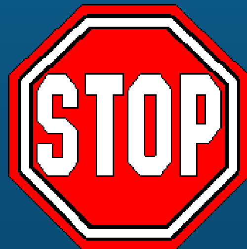
Illustration: Public Domain

© 2012 APEC秘书处，密歇根州立大学和世界银行集团。许可：知识共享署名-相同方式共享3.0 Unported (CC-BY-SA)。